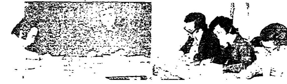
المنسيور اغناطيوس مارونينو البان الغنابي للمؤتمر